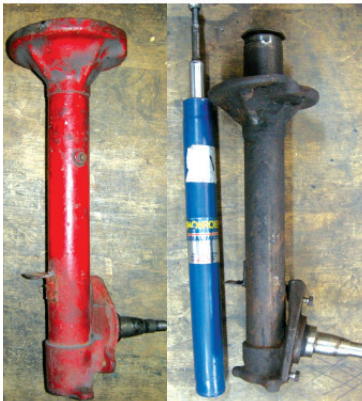
Jambes de force MacPherson / MacPherson struts

A damper that incorporates two adjusters in one mounting eye (as seen on the left but numerous versions exist) will be a monotube damper. To give an idea of scale, the holes in the adjuster wheels on this particular unit are just over 1 mm in diameter.