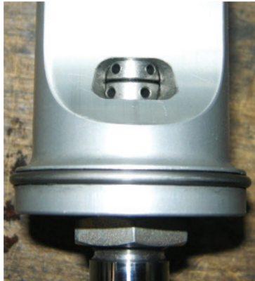
Monotube réglable dans les deux sens / Double adjustable monotube

Lorsque des cartouches MacPherson pour jambes de force monotubes (installation à l'envers) sont utilisées, le diamètre du tube visible (pas du corps de la jambe) doit être conforme au diamètre de période. Les Escorts, Mark 1 et 2, utilisaient d'ordinaire des cartouches Bilstein en période, monotubes, non réglables, avec un diamètre de tube de 41 mm. Des cartouches de 50 mm étaient utilisées sur la Lancia Stratos et la Fiat 131. Un dispositif de réglage au sommet de la jambe de force peut correspondre à une conception monotube réglable. Les réservoirs non incorporés sont d'une spécification ultérieure.