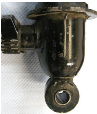
Armstrong à réglage unique / Armstrong single adjustable