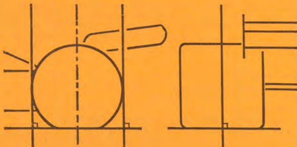
Dessin No 15: Art 3.5—Détermination de l'axe d'une roue.

5) Sauf en cas de traction avant, où la mesure sera prise à partir de l'axe des roues les plus en arrière portant une charge substantielle, aucune partie de la voiture ne sera située à plus de 60 cm en arrière de l'axe des roues tractrices les plus en arrière.