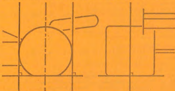
Drawing No 15: Art 3.5.—Wheel centre-line determination.

5) Except in the case of front-wheel drive when the measurement will be taken from the centre-line of the rearmost substantial load-carrying wheels, no part of the car shall be more than 60 cm behind the centre-line of the rearmost driving wheels. No part of the car shall be more than 120 cm in front of the centre-line of the foremost front wheels. The centre-line of any wheel shall be deemed to be half way between two straight edges, perpendicular to the surface on which the car is standing, placed against opposite sides of the complete wheel at the centre of the tyre tread.