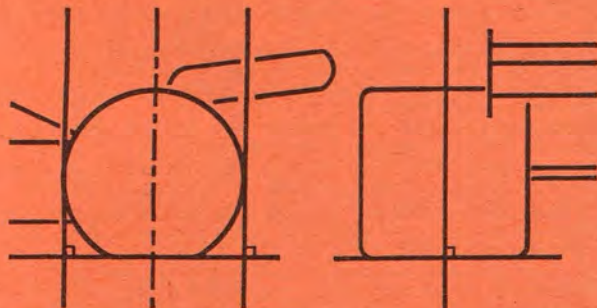
Dessin N° 1 : Article 3.5 - Détermination de l'axe d'une roue.

The periphery of the surface formed by these parts may be curved upwards with a maximum radius of 5 cm.